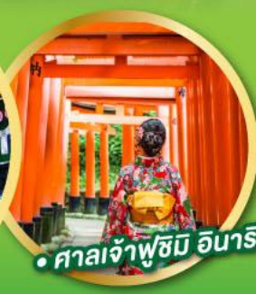
• ศาลเจ้าฟูชิมิ อินาริ