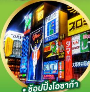
• ช้อปปิ้งโอซาก้า

เส้นทางสายอัลไพน์ทาเคยาม่า (Japan Alps Snow wall)